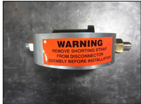
Figura 2: Vista típica de Protecta*Lite seccionador como recibido.