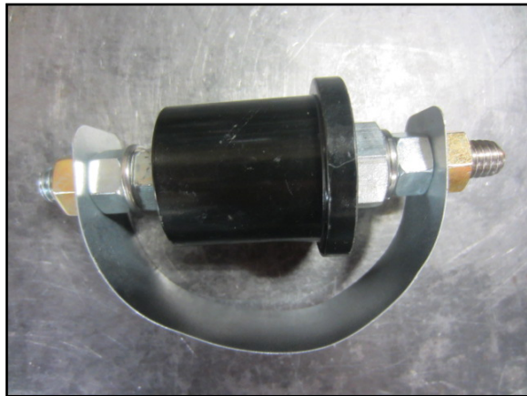
Figura 1: Vista típica de Protecta*Lite seccionador como recibido.

Es necesario empacar el desconector (explosor) del ensamblaje del pararrayos con una cinta de restricción o seguridad. Cualquier cinta de restricción del empaque deberá ser completamente removida antes de la instalación. Si no se retira la cinta de restricción podría dificultar la operación exitosa del seccionador.