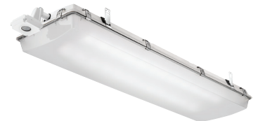
Industrial & Exterior