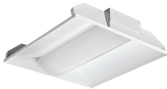
Lineal de interior