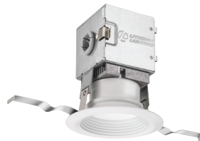
Compacto de interior